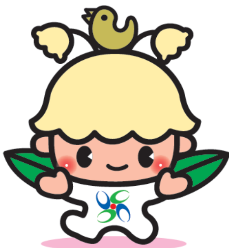
宇陀市マスコットキャラクター「ウッピー」