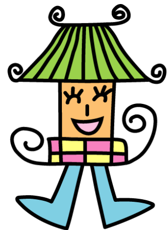
唐古・鍵遺跡 キャラクター 楼閣くん

保証協会 業務課 (0742-33-0552) または、 田原本町 観光・まちづくり推進課 (0744-34-2080)